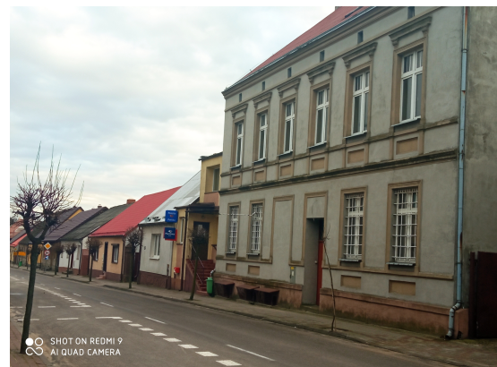
SHOT ON REDMI 9 AI QUAD CAMERA