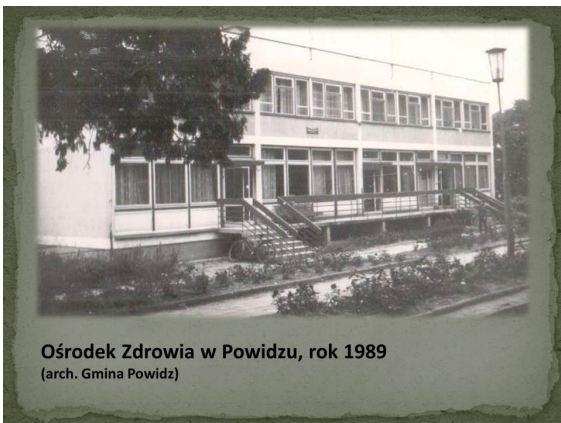
Ośrodek Zdrowia w Powidzu, rok 1989