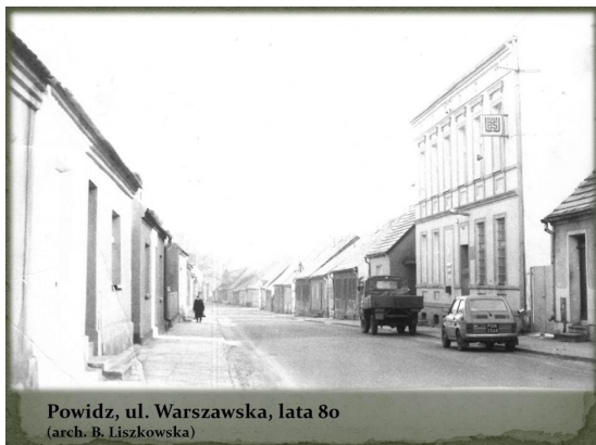
Powidz, ul. Warszawska, lata 80 (arch. B. Liszkowska)